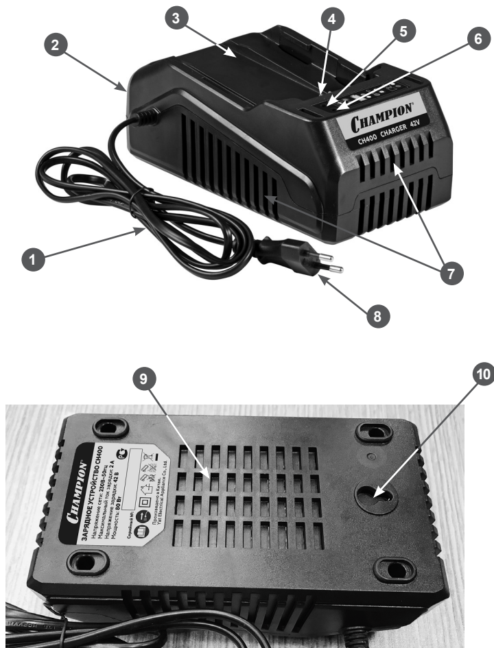
Рис. 1 Основные узлы и органы управления

Основные узлы и органы управления зарядного устройства показаны на Рис. 1.