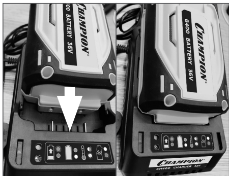
Рис. 2 Установка аккумулятора в зарядное устройство

Если аккумулятор слишком горячий, красный и зеленый свет будут мигать. Если аккумулятор сломан, красный свет начнет мигать (Рис. 3).